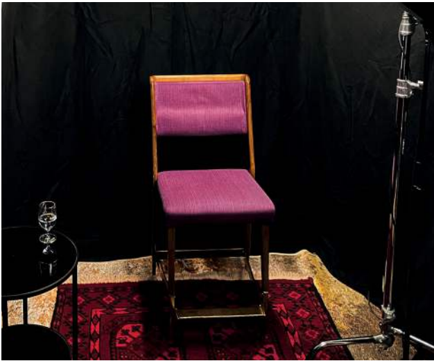
Setting für das Erinnerungsbüro