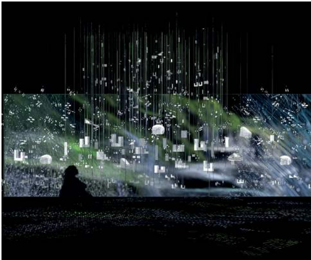
Merve Sahin, Merging Visions , Rendering für die VR-Applikation