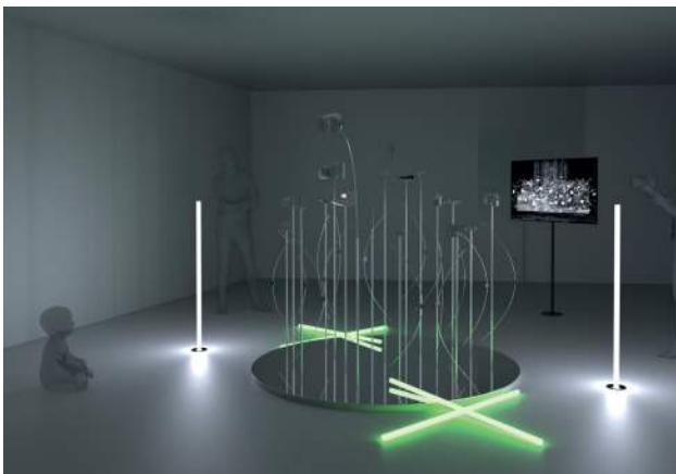
Visualisierung des Garden of Objects