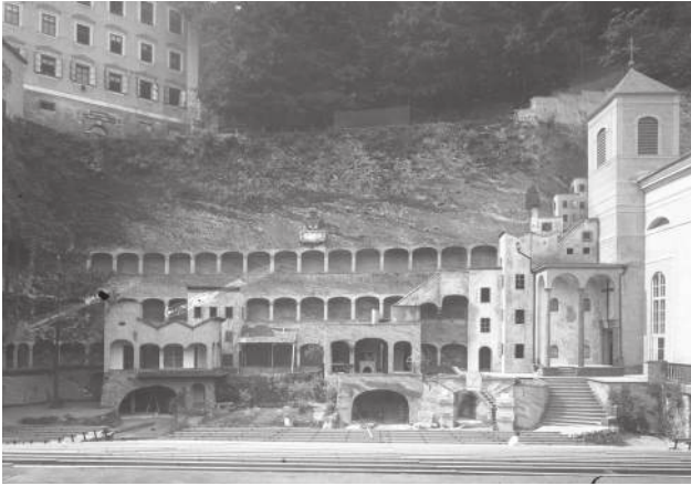
Gesamtansicht der Faust-Stadt (oben links die Edmundsburg)