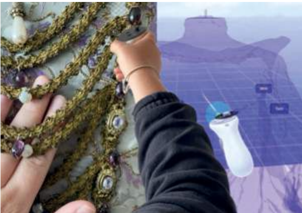
Iz Paehr, Feeling Virtual