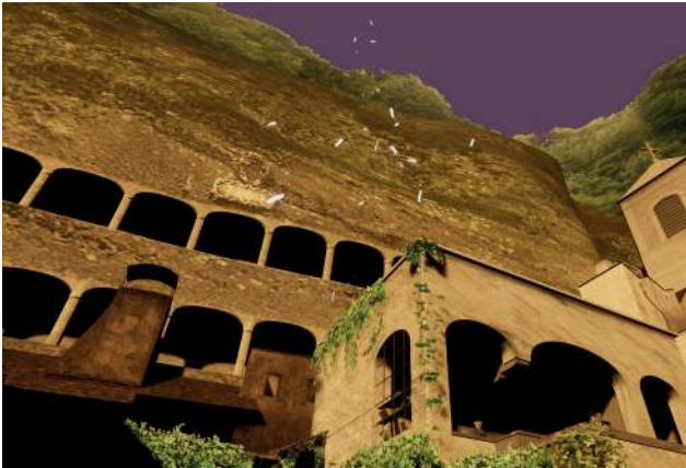
Visualisierung der VR-Applikation