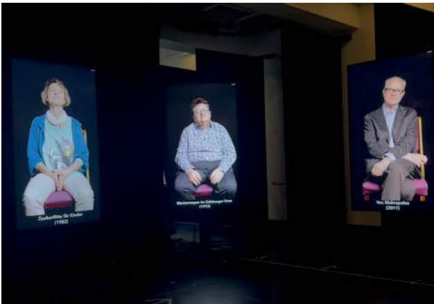
Mats Staub, Visualisierung der Installation des Erinnerungsbüros