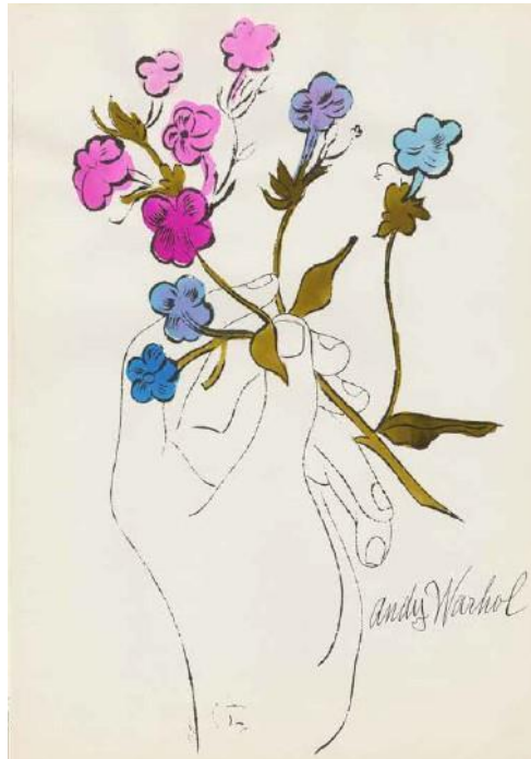
Andy Warhol, Hand and Flowers, 1957, offset lithograph and watercolor on paper (36.2 x 25.4 cm; 2000.2.1354) The Andy Warhol Museum, Pittsburgh; Founding Collection, Contribution The Andy Warhol Foundation for the Visual Arts, Inc.