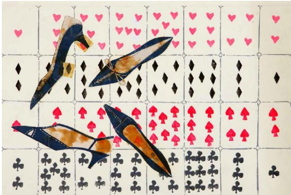
Andy Warhol, Four Shoes with Playing Card Suits, 1950s, tempera and printed collage on Strathmore paper (38.7 x 61 cm; 1998.1.1295) The Andy Warhol Museum, Pittsburgh; Founding Collection, Contribution The Andy Warhol Foundation for the Visual Arts, Inc.