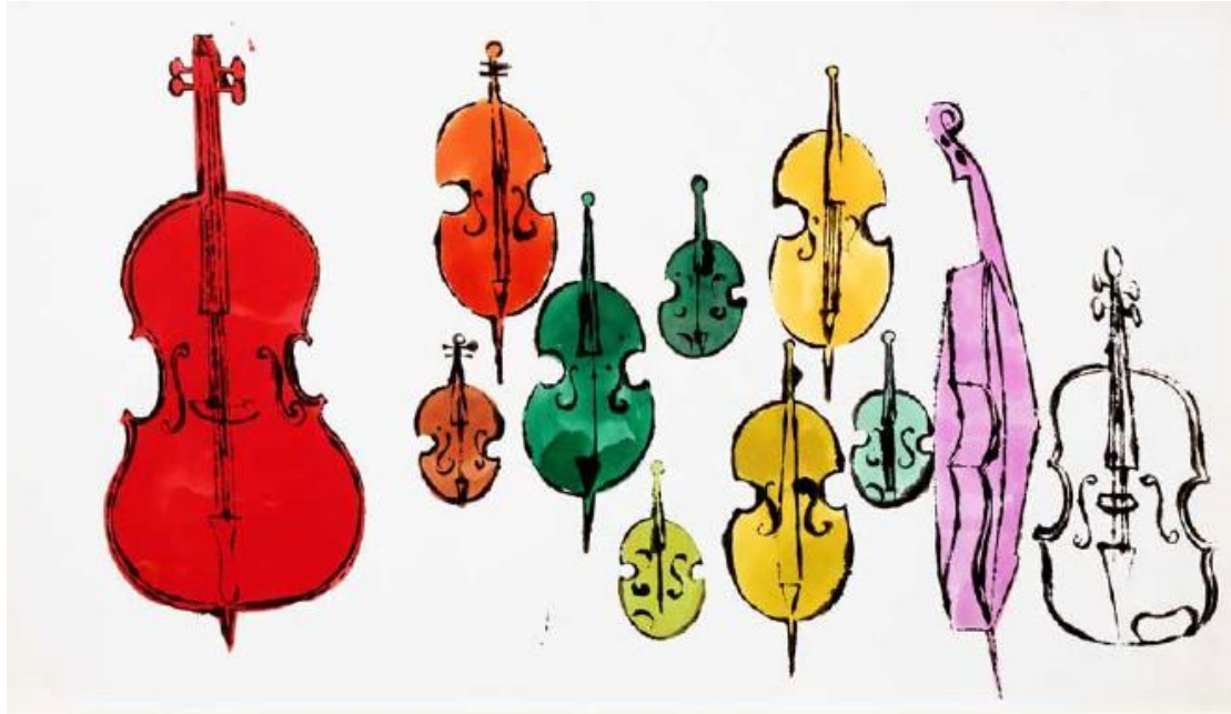
Andy Warhol, Eleven String Instruments, c. 1957, ink and Dr. Martin's Aniline dye on Strathmore paper (33 x 57.2 cm)