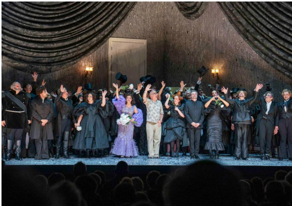
Schlussapplaus bei der Premiere von Il viaggio a Reims im Haus für Mozart. Die Neuinszenierung von Barrie Kosky stand im Zentrum der Salzburger Festspiele Pfingsten 2026.

(SF, 25. Mai 2026) „Bon Voyage!“ hieß es bei den Salzburger Pfingstfestspielen 2026, die mit euphorischem Publikumszuspruch und einer Auslastung von 99 Prozent heute ihren Abschluss finden.