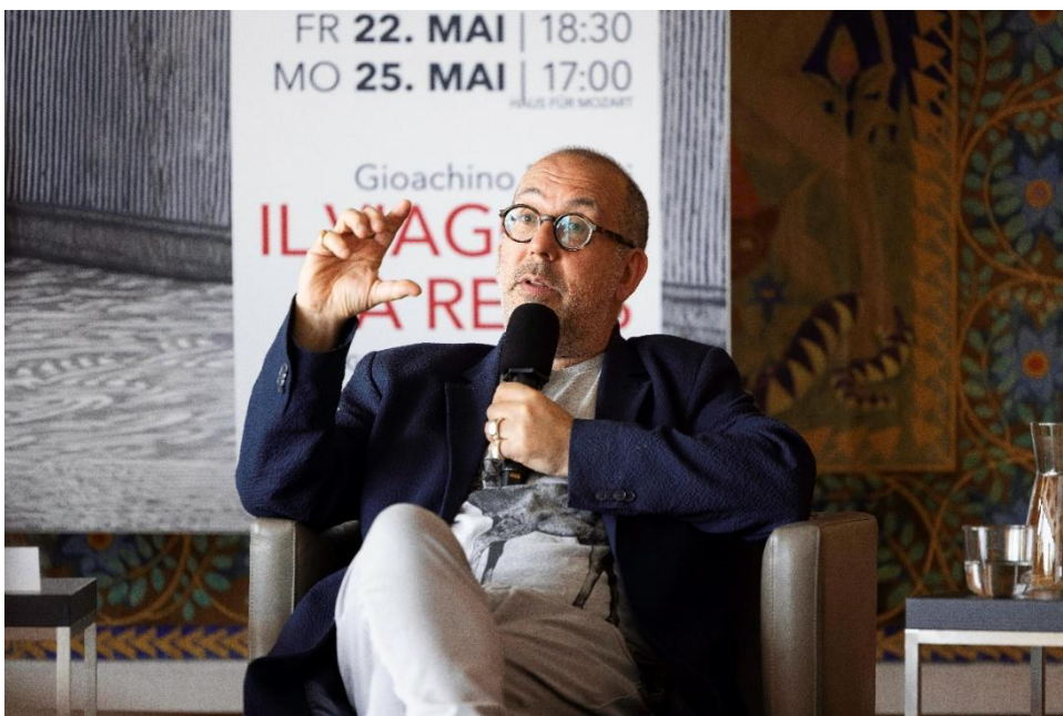
Regisseur Barrie Kosky inszeniert zum zweiten Mal bei den Pfingstfestspielen und zum vierten Mal in Salzburg.