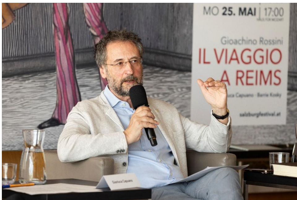
Gianluca Capuano, Chefdirigent von Les Musiciens du Prince – Monaco

Kosky eine besondere Ausgangslage mit sich: „Es ist eine der besten Musiken, die Rossini je geschrieben hat. Für einen Regisseur ist es ein Geschenk, weil man eine komplett neue Geschichte bauen kann. Es gibt wenig Rezeptionsgeschichte, daher ist das Publikum nicht vorbelastet, zugleich ist der Plot unmittelbar verständlich. Es gibt keinen Moment der Langeweile in der Musik oder in dem Stück – aber man muss mit dem Vorhandenen schon etwas machen.“ Was geschieht? Eine illustre Gesellschaft ist auf der Reise zu einer Krönung und bleibt auf dem Weg in einem Hotel hängen, weil absurderweise alle Pferde im Ort abhandengekommen sind. Barrie Kosky: „In den ersten 30 Minuten ist die einzige dramatische Sache, die im Libretto passiert, dass eine französische Contessa denkt, dass ihr Hut verloren gegangen ist. Darüber singt sie eine „Wahnsinns“-Arie, als wäre sie Lucia di Lammermoor. Sie bekommt den Hut zurück und singt eine Arie, als wäre der Hut ihre große Liebe. Um dieses bisschen Geschichte, dieses Skelett, baut Rossini sensationelle Musik.“