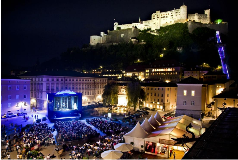
Siemens Fest>Spiel>Nächte am Kapitelplatz in Salzburg