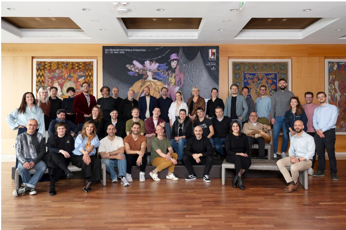
Die Künstlerische Leiterin Cecilia Bartoli mit dem Leading Team und dem Ensemble der Produktion Il viaggio a Reims. Zu Pfingsten findet die Premiere am 22. Mai statt.

(SF, 17. April 2026) Cecilia Bartoli in medias res und auf allen Bühnen: Sie probt für den Gala-Abend „Ciao, bella ciao“, der eine Zeitreise durch ihren musikalischen Kosmos verkörpern wird. Und soeben ist die erste Probenwoche von Gioachino Rossinis Opera buffa Il viaggio a Reims , einer Neuinszenierung der Salzburger Festspiele Pfingsten, erfolgreich gestartet.