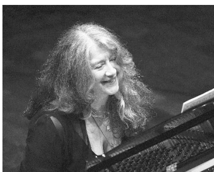
Martha Argerich