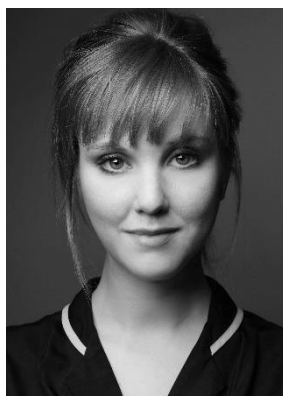
Mélissa Petit © C.Swan