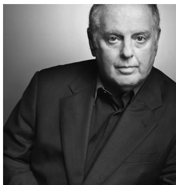
Daniel Barenboim

https://www.salzburgerfestspiele.at/presse#fotoservice