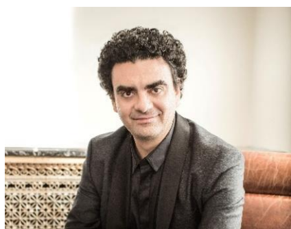
Rolando Villazón