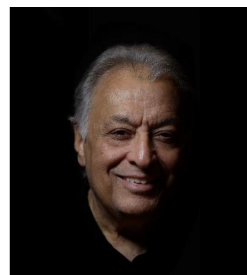
Zubin Mehta