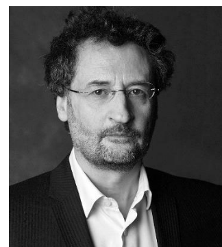
Gianluca Capuano