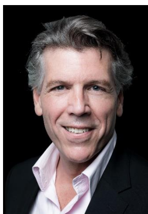
Thomas Hampson