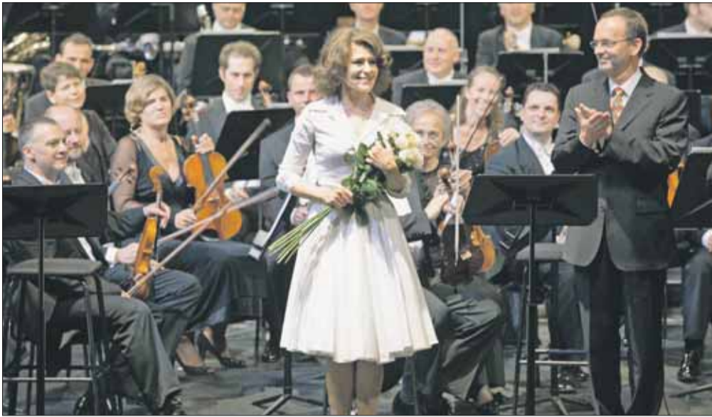
Arthur Honeggers Jeanne d'Arc au bûcher in der Felsenreitschule