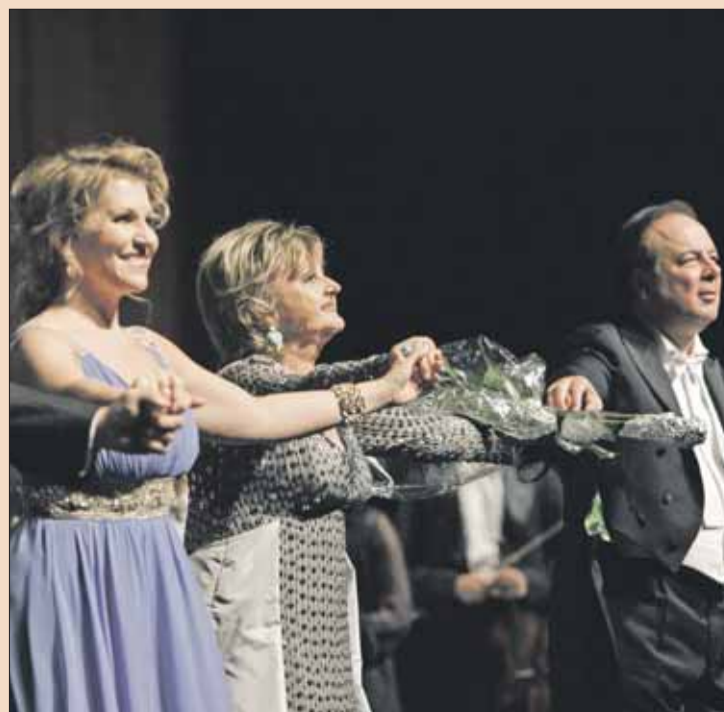
Joyce DiDonato, Edita Gruberova, Ferruccio Furlanetto

A queen holds court in Bellini's Norma , the Wiener Zeitung headlined during the past days. Der Standard heard „a singer from Mount Olympus“; the Salzburger Nachrichten wrote about a „model and stylistic school“: Edita Gruberova sang Vincenzo Bellini's Norma in a concert performance.