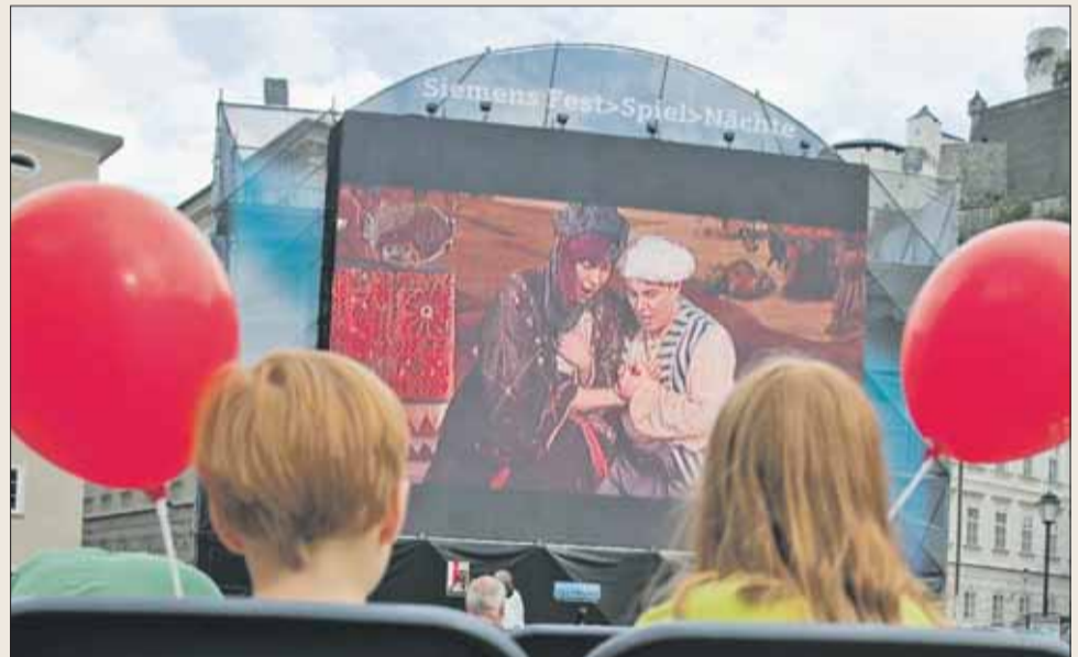
Das Siemens Kinder&gt;Festival bringt Kinderoper auf den Kapitelplatz.