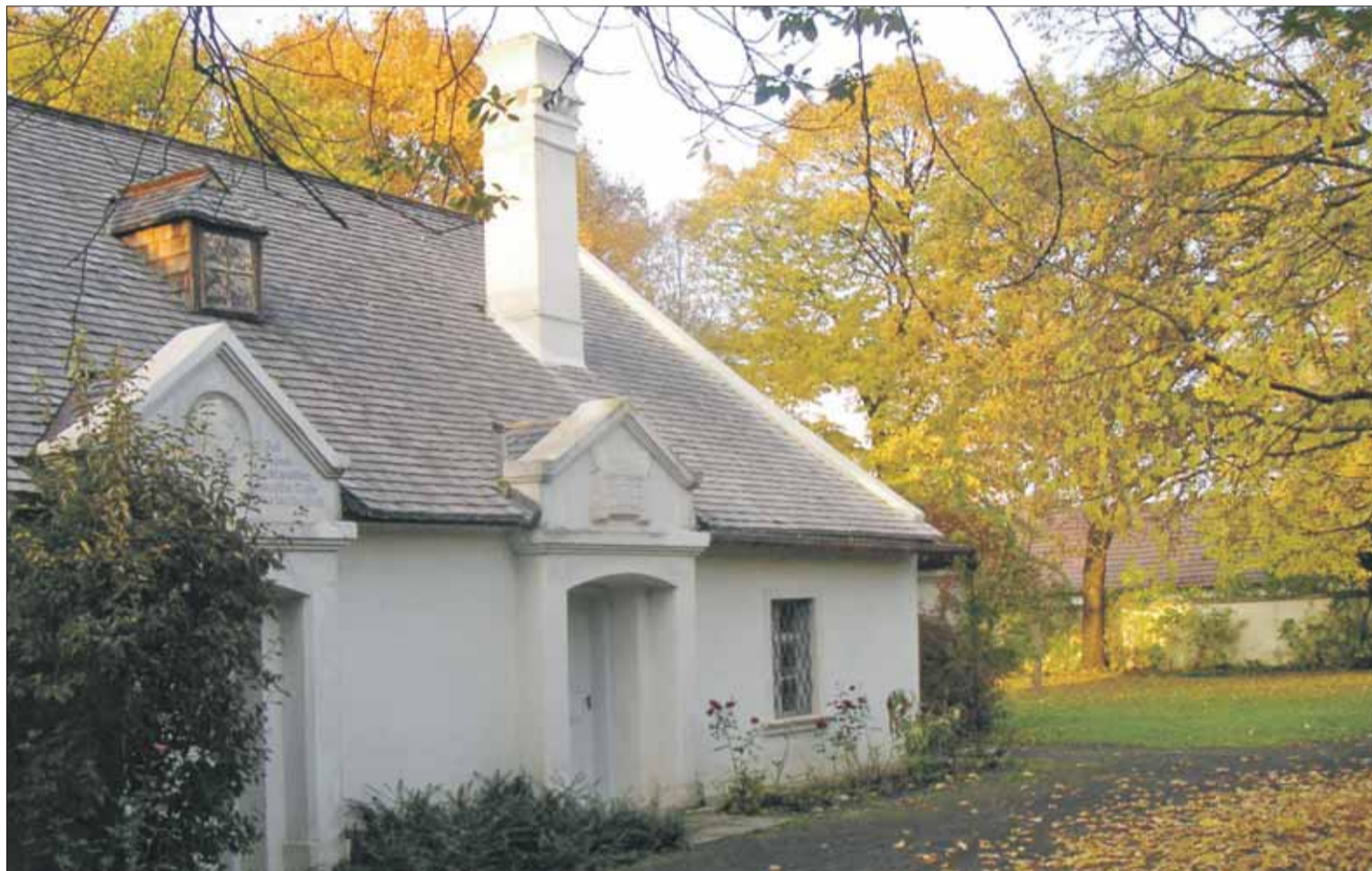
Das Geburtshaus von Franz Liszt in Raiding/Burgenland