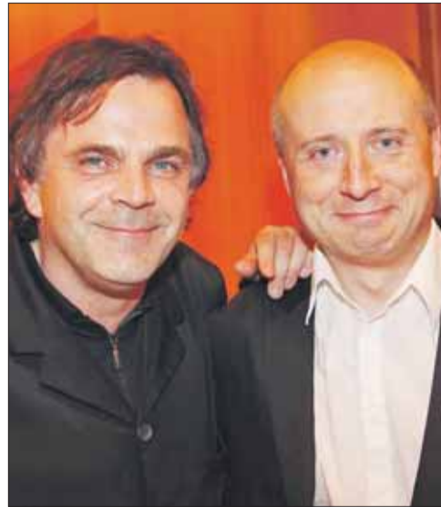
Die Deutsche Kammerphilharmonie Bremen feierte ihren bejubelten Beethoven-Zyklus. Im Bild Konzertchef Markus Hinterhäuser mit Dirigent Paavo Järvi.