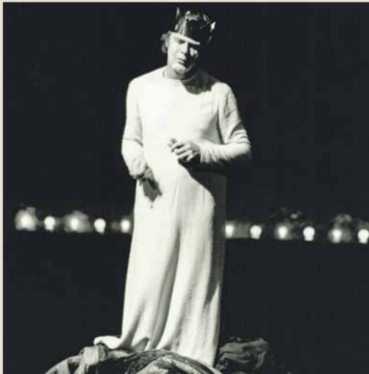
Michael Heltau in Strehlers Spiel der Mächtigen, 1973