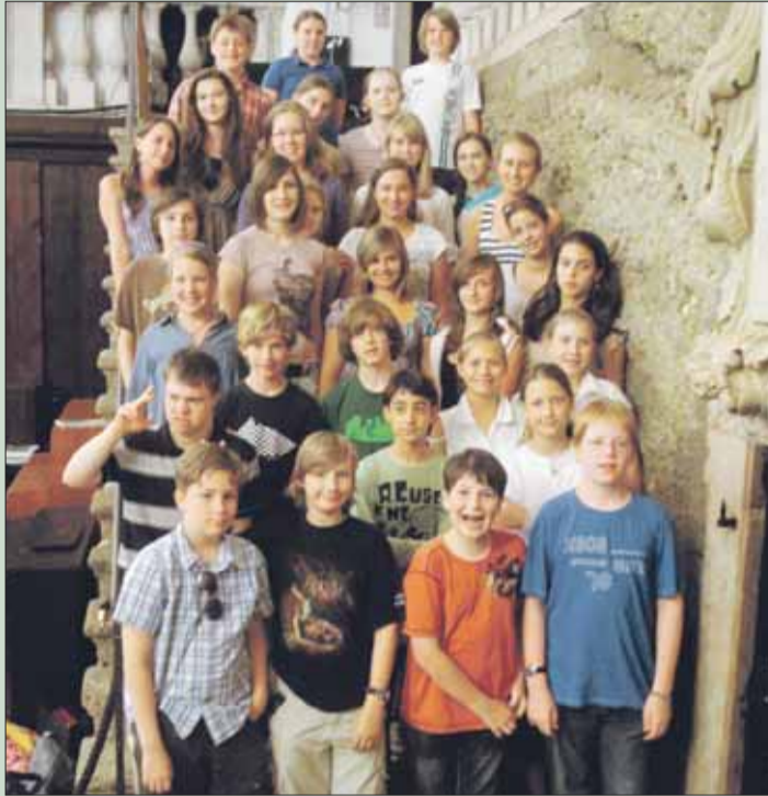
Die Teilnehmer des Nono-Musikcamps

Ein weiteres Zusatzangebot der Salzburger Festspiele möchte Luigi Nonos Musik vermitteln helfen und richtet sich an ein erwachsenes Publikum: Exegese Nono bietet ab 2. August vier Einführungen im Schüttkasten bzw. in der Großen Universitätsaula. Zu hören sein wird u. a. Nonos Streichquartett An Diotima , das in seinem Werk eine signifikante Stelle einnimmt, gespielt vom Arditti Quartet. Durch die Gespräche führt Klaus Zehelein.